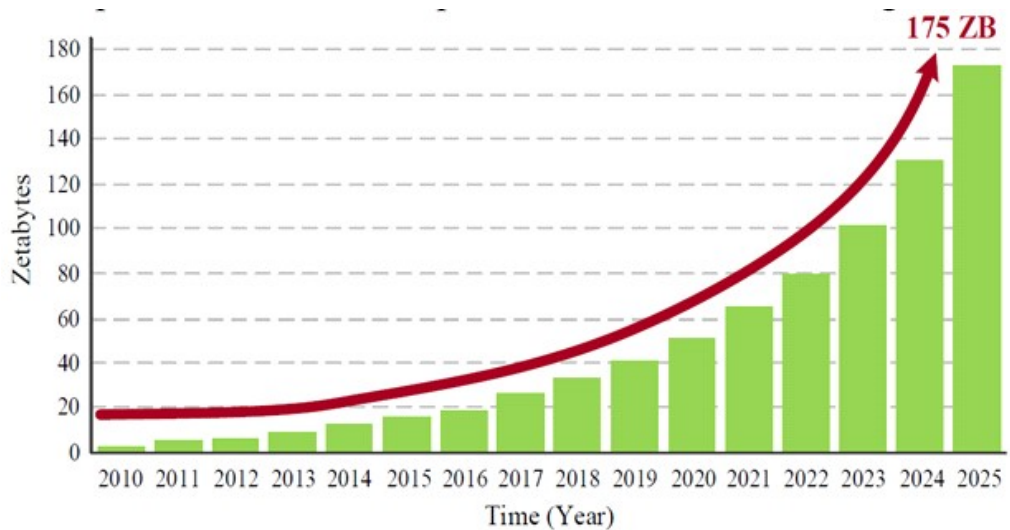
Figure :- Annual Growth Rate of Global Data [3]

The analysis of large amounts of data has become more important in modern research as well as in modern business. These data are generated as a result of online transactions, emails, movies, music, photos, click streams, logs, postings, search queries, medical records, interactions on social networks, scientific data, sensors, mobile phones, and the programs that run on them . Big data is stored in databases that grow incrementally and contain a large volume of information, making storage, management, sharing, analysis, and data visualization complex tasks that require software tools and complex databases. Throughout the course of the previous two decades, there has been a significant expansion of data in a variety of domains . According to a report that was published by the International Data Corporation (IDC) in 2011, the total volume of data that was produced and copied in the world was 1.8 zettabytes ( 1.8 \times 10^{24} exabytes) [4]. This figure has since increased to 40 zettabytes and is projected to reach 175 zettabytes by the year 2025. The progression of big data's expansion from 2010 to its anticipated level of development in 2025 is seen in Figure.